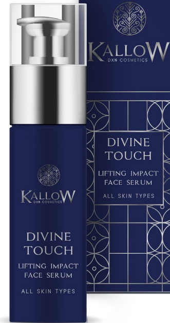
ΟΡΟΣ ΠΡΟΣΩΠΟΥ ΑΜΕΣΗΣ ΑΝΟΡΘΩΣΗΣ