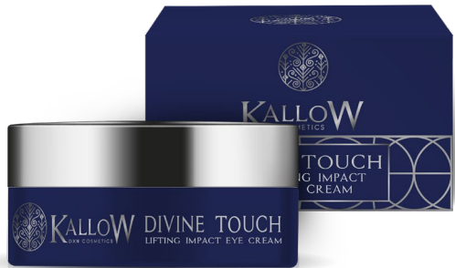
ΚΡΕΜΑ ΜΑΤΙΩΝ ΑΜΕΣΗΣ ΑΝΟΡΘΩΣΗΣ