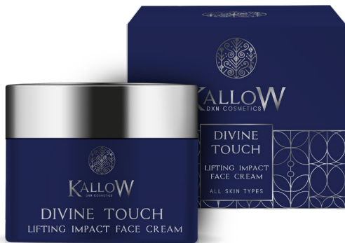
ΚΡΕΜΑ ΠΡΟΣΩΠΟΥ ΑΜΕΣΗΣ ΑΝΟΡΘΩΣΗΣ