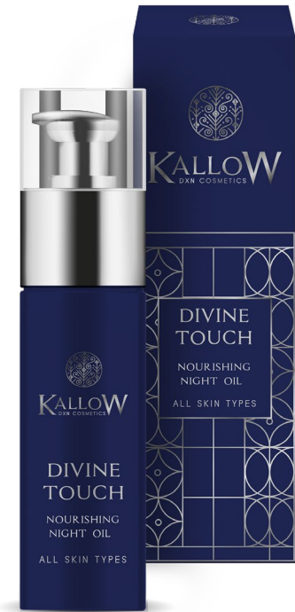
ΕΝΥΔΑΤΙΚΟ ΛΑΔΙ ΠΡΟΣΩΠΟΥ ΝΥΚΤΟΣ