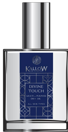
ΠΟΛΥΧΡΗΣΤΙΚΟ ΞΗΡΟ ΛΑΔΙ